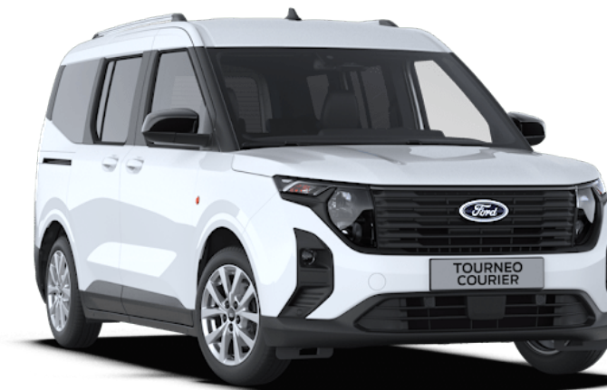
Frozen White Απλό χρώμα αμαξώματος