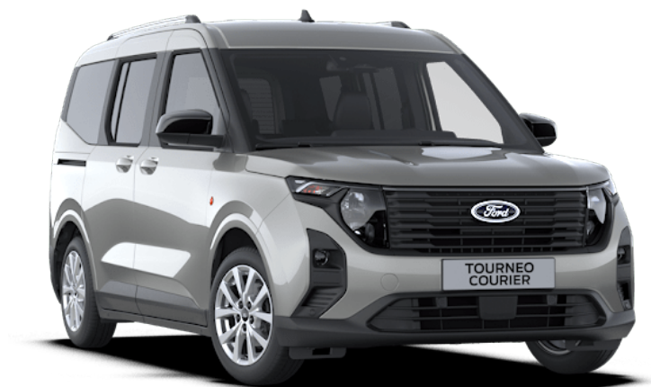
Solar Silver Μεταλλικό χρώμα αμαξώματος*

Σημείωση: Οι φωτογραφίες χρησιμοποιούνται μόνο για την παρουσίαση των χρωμάτων και μπορεί να μην απεικονίζουν την τρέχουσα προδιαγραφή του αυτοκινήτου ή τα μοντέλα που μπορεί να διατίθενται σε συγκεκριμένες αγορές. Τα χρώματα και οι επενδύσεις που εμφανίζονται σε αυτές τις σελίδες μπορεί να διαφέρουν από τα πραγματικά χρώματα εξαιτίας των περιορισμών εκτύπωσης και των πολλών διαφορετικών τύπων των μέσων αποτύπωσης.