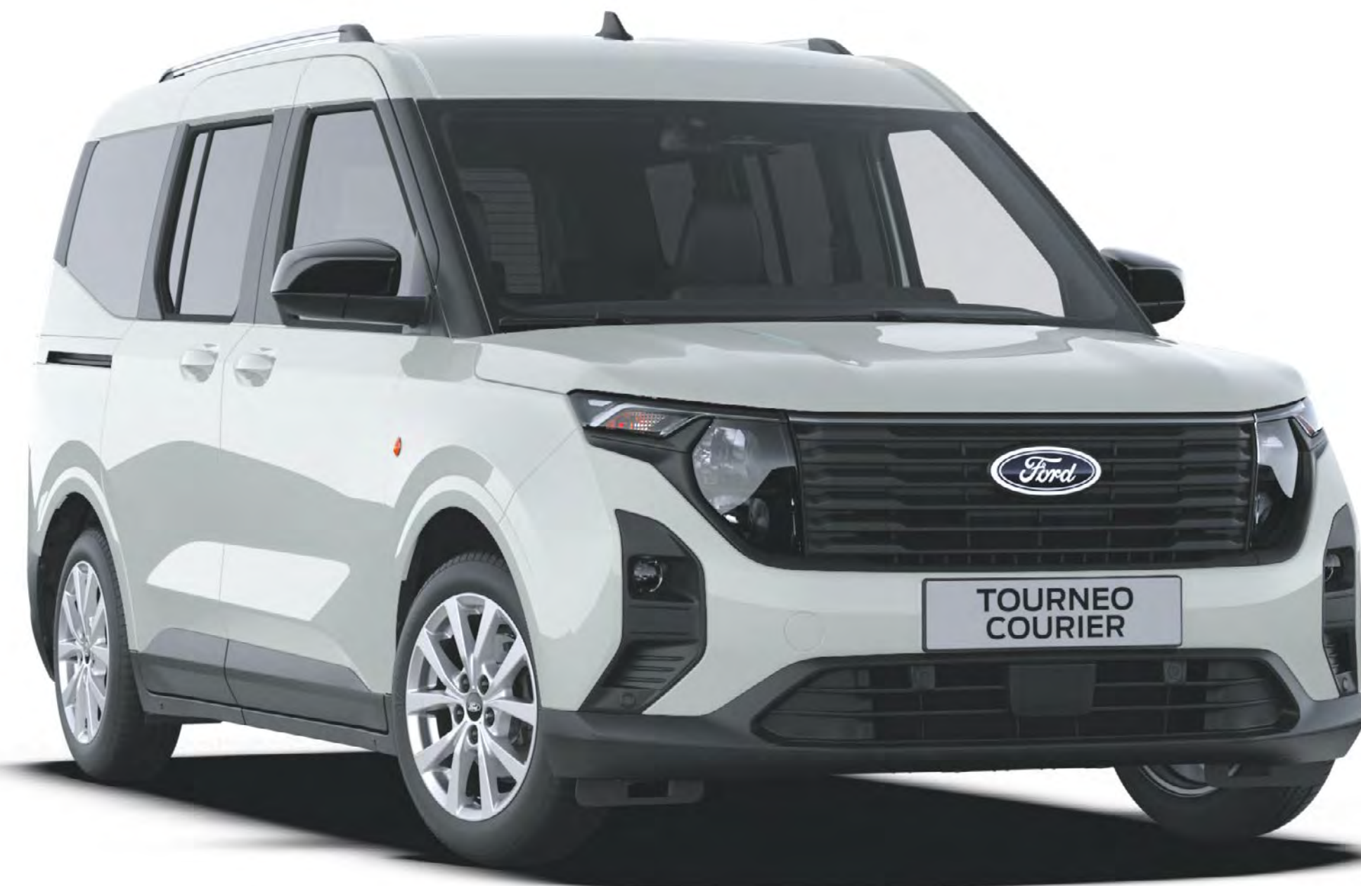
Cactus Grey Απλό χρώμα αμαξώματος

Το Ford Tourneo Courier οφείλει το ανθεκτικό εξωτερικό του σε μια ειδική διαδικασία βαφής πολλαπλών σταδίων, η οποία εξασφαλίζει ότι το νέο σας αυτοκίνητο θα διατηρήσει την όμορφη εμφάνισή του για πολλά χρόνια.