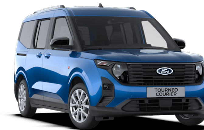
Desert Island Blue Μεταλλικό χρώμα αμαξώματος*