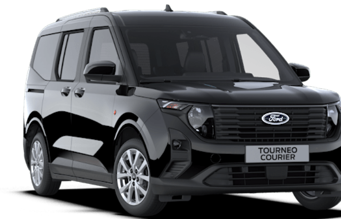
Agate Black Μεταλλικό χρώμα αμαξώματος*