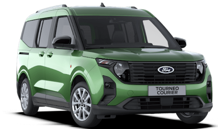
Bursting Green Μεταλλικό χρώμα αμαξώματος*