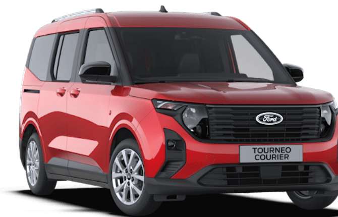
Fantastic Red Ειδικό μεταλλικό χρώμα αμαξώματος*