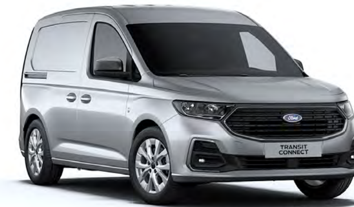
Stardust Silver Μεταλλικό χρώμα αμαξώματος*