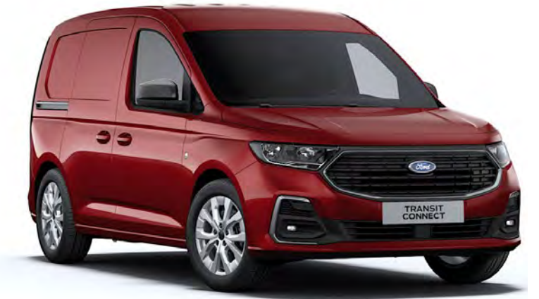
Maple Red Μεταλλικό χρώμα αμαξώματος*