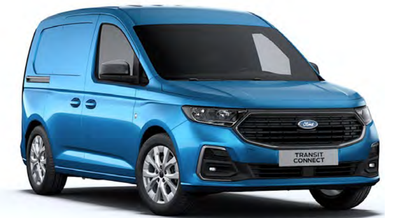
Boundless Blue Μεταλλικό χρώμα αμαξώματος*

Σημείωση: Οι φωτογραφίες χρησιμοποιούνται μόνο για την παρουσίαση των χρωμάτων και μπορεί να μην απεικονίζουν την τρέχουσα προδιαγραφή του αυτοκινήτου ή τη διαθεσιμότητα των μοντέλων σε δεδομένες αγορές. Τα χρώματα και οι επενδύσεις που εμφανίζονται σε αυτές τις σελίδες μπορεί να διαφέρουν από τα πραγματικά χρώματα εξαιτίας των περιορισμών και της ποικιλίας των μεθόδων αποτύπωσης.