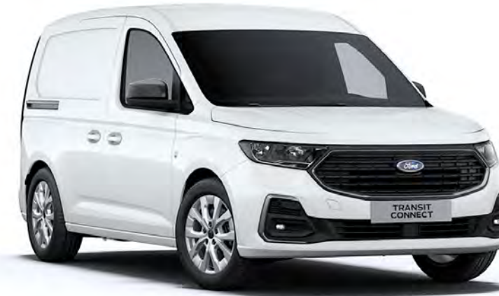
Frozen White Απλό χρώμα αμαξώματος