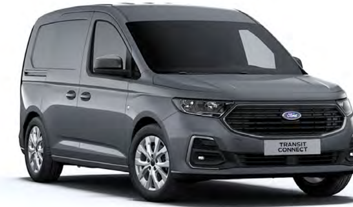
Comet Grey Απλό χρώμα αμαξώματος