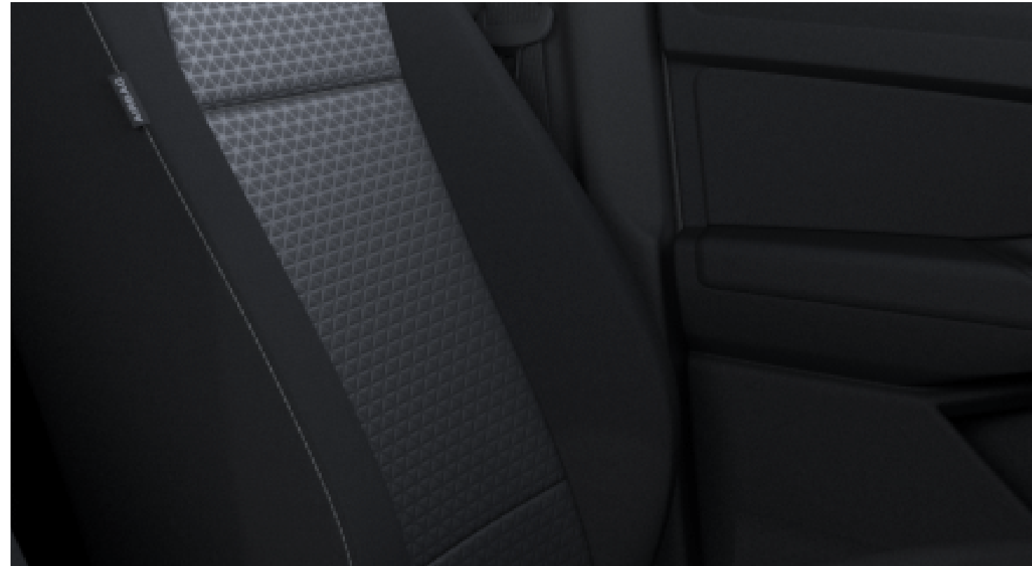
Ανάγλυφο Bubble Ford Kylo σε Soul/Clip σε Soul (με γκρι ραφή) Βασικός εξοπλισμός στο Limited