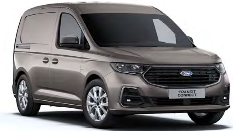
Dusky Silver Μεταλλικό χρώμα αμαξώματος*