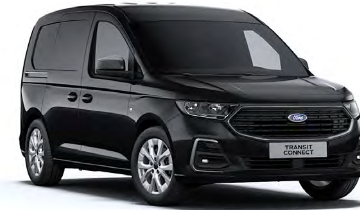
Ink Black Μεταλλικό χρώμα αμαξώματος*