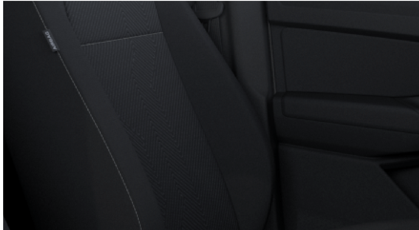
Exnor σε Soul/Clip σε Soul Βασικός εξοπλισμός στο Trend