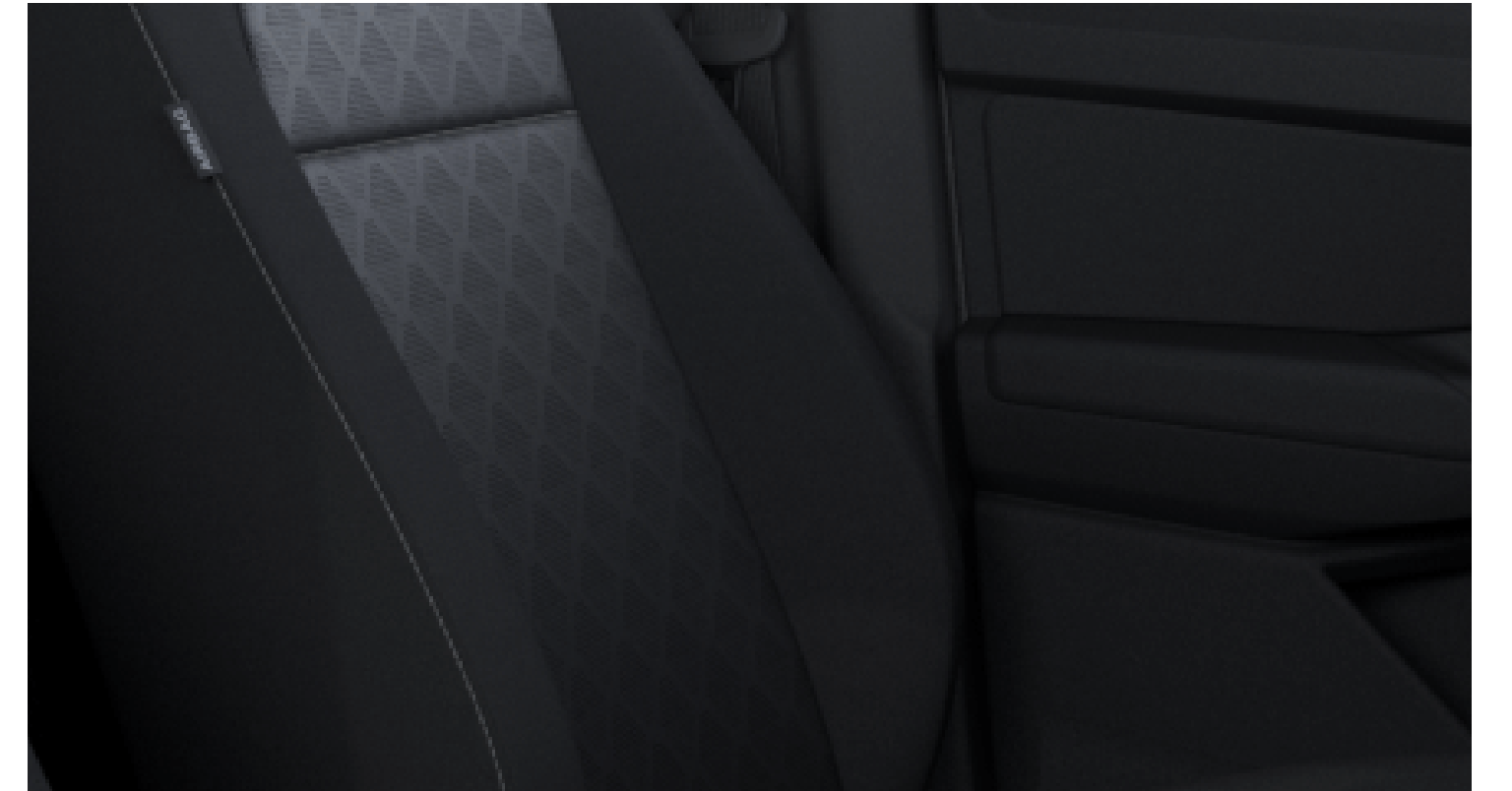
Διάτρητο Ford Diamond Sensico® σε Soul/Bison Sensico® με μικροκοκκώδη υφή σε Soul Προαιρετικός εξοπλισμός στο Limited

Σημείωση: Το Sensico® είναι εμπορικό σήμα της Ford EU και αναφέρεται σε υψηλής ποιότητας συνθετικά υφάσματα που έχουν αναπτυχθεί για εσωτερικούς χώρους αυτοκινήτων. Ως ταπετσαρία vegan, συνδυάζει υψηλής ποιότητας και απαλή αίσθηση, είναι ανθεκτική και έχει υπέροχη εμφάνιση. Καθαρίζεται εύκολα και αντέχει σε λεκέδες και οσμές. Με εμφάνιση υψηλής ποιότητας, η επένδυση Sensico® δεν προσφέρει μόνο υπέροχη αίσθηση όταν κάθεστε σε αυτήν κατά τη διάρκεια μιας πολύωρης διαδρομής αλλά απαντά και στις συνειδησιακές σας ανησυχίες, καθώς δεν είναι ζωικής προέλευσης. Η σχεδιάσή της προσφέρει αίσθηση ηρεμίας και σιγουριάς στους τωρινούς και στους μελλοντικούς οδηγούς.