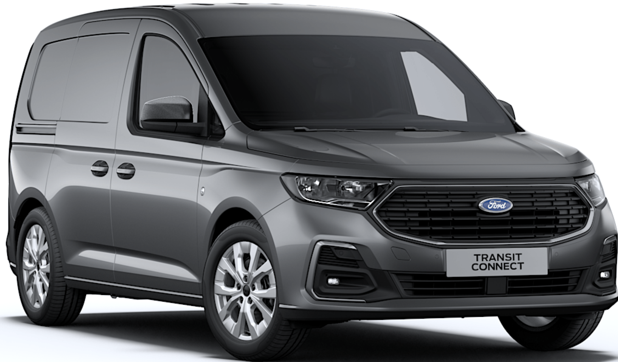
Graphite Grey Μεταλλικό χρώμα αμαξώματος*

Το Ford Transit Connect οφείλει το ανθεκτικό εξωτερικό του σε μια ειδική διαδικασία βαφής πολλαπλών σταδίων, η οποία εξασφαλίζει ότι το νέο σας αυτοκίνητο θα διατηρήσει την όμορφη εμφάνισή του για πολλά χρόνια.