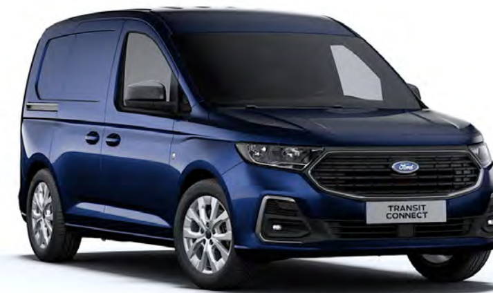
Midnight Blue Μεταλλικό χρώμα αμαξώματος*