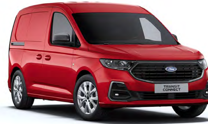
Lava Red Απλό χρώμα αμαξώματος