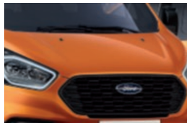
Πλέγμα μάσκας Active στο δικό του χρώμα με διακοσμητικό Satin Nickel (Βασικός εξοπλισμός)