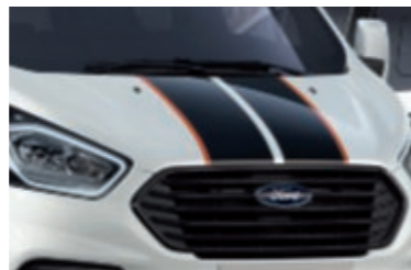
Σπορ λωρίδες και σπορ μάσκα (Βασικός εξοπλισμός)