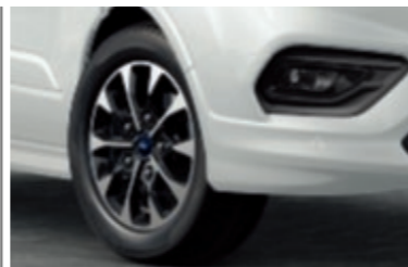
Ζάντες ελαφρού κράματος 17" 5x2 ακτίνων με φινίρισμα μαύρο / μεταλλικό φρεζαριστό (Βασικός εξοπλισμός)