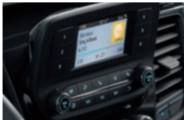
Ford SYNC με οθόνη 4" TFT (βασικός εξοπλισμός)