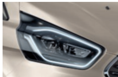
Προβολείς Bi-Xenon (Βασικός εξοπλισμός)