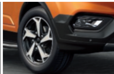
Ζάντες ελαφρού κράματος 17" 5 ακτίνων με μεταλλικό φρεζαριστό φινίρισμα (Βασικός εξοπλισμός)

*Το σύστημα κλήσης έκτακτης ανάγκης Ford Emergency Assistance είναι ένα πρωτοποριακό σύστημα του Ford SYNC που χρησιμοποιεί κινητό τηλέφωνο ασύρματα συνδεδεμένο μέσω Bluetooth® για να καλέσει αυτόματα το τοπικό κέντρο πολιτικής προστασίας μετά από σύγκρουση που θα κάνει κάποιον αερόσακο να ανοίξει ή την αντλία καυσίμου να κλείσει αυτόματα. Το σύστημα λειτουργεί σε περισσότερες από 40 Ευρωπαϊκές χώρες και περιφέρειες.