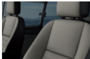
Δερμάτινη επένδυση καθισμάτων (προαιρετική επιλογή)