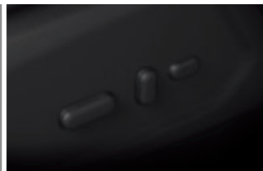
Ηλεκτρικά ρυθμιζόμενο και θερμαινόμενο κάθισμα οδηγού (προαιρετική επιλογή)

Σημείωση: Plug-in Hybrid και Shuttle Bus διαθέτουν ζάντες ελαφρού κράματος 16". Τα χαρακτηριστικά του Plug-in Hybrid διαφέρουν, ελέγξτε τους πίνακες προδιαγραφών για λεπτομέρειες.