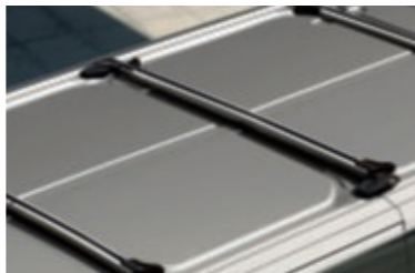
Ενσωματωμένες μπάρες οροφής (προαιρετική επιλογή)